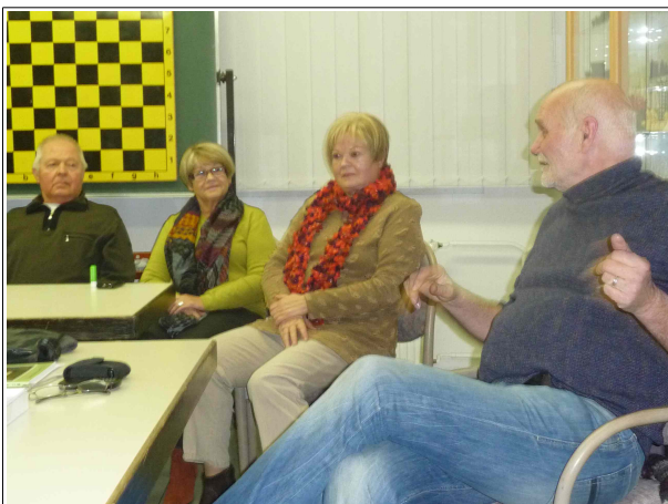
Der Künstler stellt das Schachmuseum vor