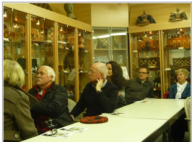
Konzentrierte und aufmerksame Besucher